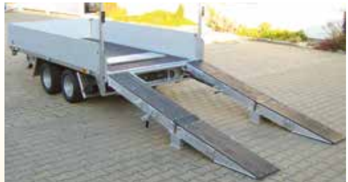
Sonderausstattungen: Bereifung 225 / 55 R12, LH ca. 670 mm, ALTEC-Klapp-Faltrampen, L x B ca. 2410 x 310 mm, Gummibelag auf Rampen, Gasfederheber an Rampen