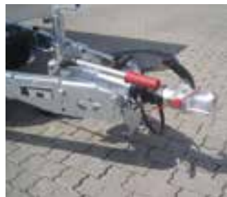
Serien-Detail: Einbindung der Zuginrichtung (Auflaufeinrichtung) in V-Deichsel - höhenverstellbar