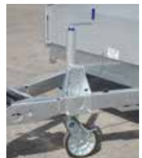
SR 70 HA Stützrad 70 mm Halbautomatisch