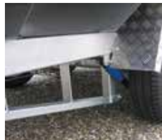
Serien-Detail: Hauptrahmen – Unterzug für lange Brücken > 4.500 mm