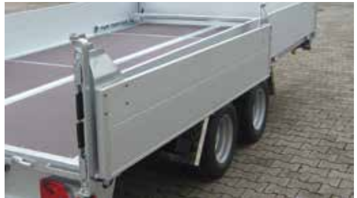
Sonderausstattungen: Rückwand abklappbar und schwenkbar mit Türfeststeller in FR rechts (vereinfacht den Rampeneinsatz)