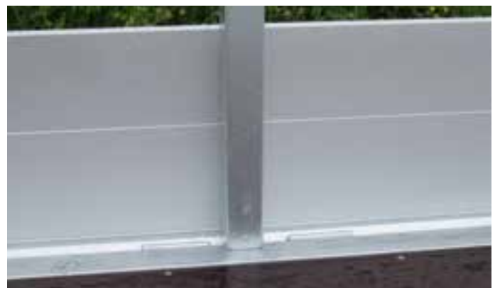
Sonderausstattung: Steckbare Rungen (60 x 40 mm) im Bodenrahmen integriert