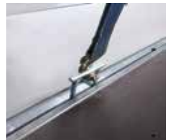
Serien-Detail: Hochziehbarer Zurrbügel (800 daN) in V-Sicke