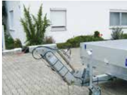
Sonderausstattung: Höhenverstellbare Zugdeichsel (Wechsel zwischen Kugel und 40er DIN-Öse möglich) 70er Stützrad verstärkt