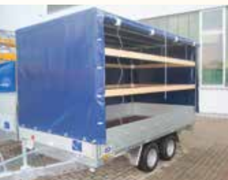
Sonderausstattung: Hochplane mit verz. Gestell und Stecklatten, Planenfarbe und Verschlüsse nach Kundenwunsch, seitlich links Planenaufroller