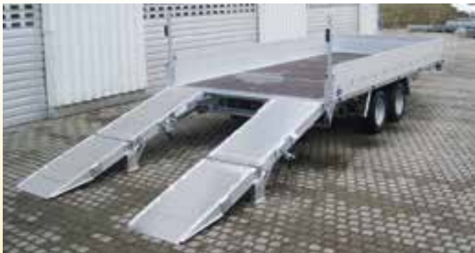
Sonderausstattungen: Bereifung 225 / 55 R12, LH ca. 670 mm, ALTEC-ALU-Klapp-Faltrampen, L x B ca. 2410 x 400 mm, Netzhaken an Bordwand