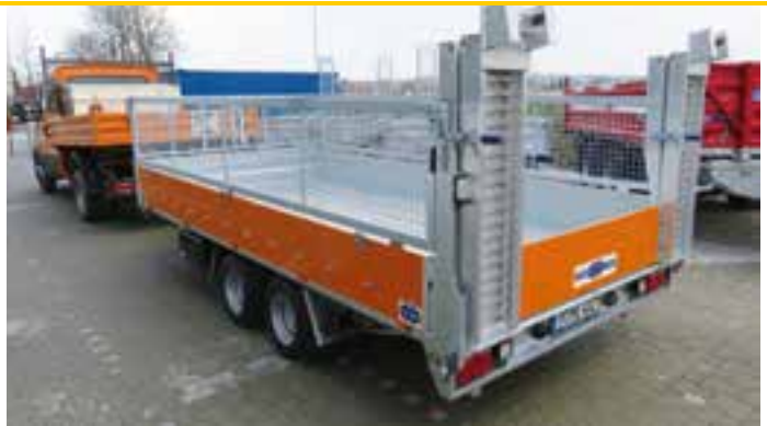
Sonderausstattungen: Bordwandlackierung, Gitteraufbau 600 mm hoch, Zusatzboden aus ALU-Tränenblech, ALTEC-Klapp-Faltrampen, L x B ca. 2410 x 310 mm, Bereifung 225 / 55 R12 - LH ca. 670 mm, Netzhaken an Bordwand