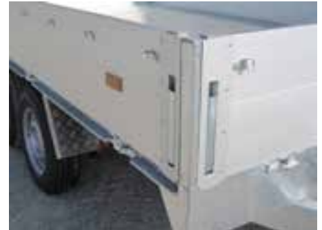
Sonderausstattung: Netzhaken an ALU-Bordwand