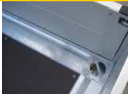
Sonderausstattung: Drehbarer Zurrstab in den Ecken (1.250 daN)