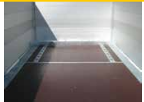
Sonderausstattungen: Maschinenanschlagschiene verstellbar, versenkte Ausführung (UE-Baureihe)