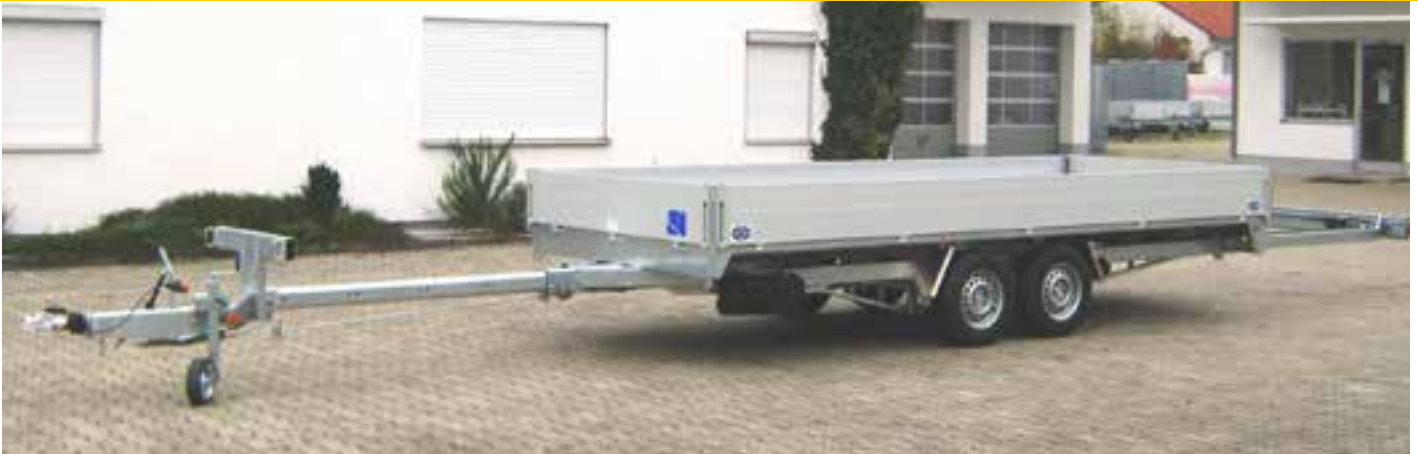
Abb: UE 35 52 20 zul. GG 3.500 kg , Brückenmaße 5.200 x 2.050 mm, Sonderausstattungen: Längenverstellbare Deichsel ca. 1.800 - 3.550 mm, abnehmbarer Material-Auflagebock auf der Deichsel (Anhänger-Ladefläche mit LV-Deichsel mind. 4.000 mm) Kunststoffstaukasten 550 x 250 x 290 mm unter der Brücke