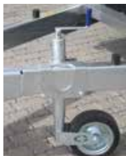
SR 60 KS Stützrad 60 mm – Klemmschelle