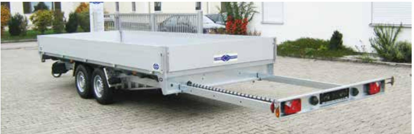
Abb: UE 35 52 20 zul. GG 3.500 kg , Brückenmaße 5.200 x 2.050 mm, Sonderausstattungen: Unterfahrschutz mit Beleuchtung ausziehbar ca. 2.000 mm (Belastung ca. 300 kg möglich)