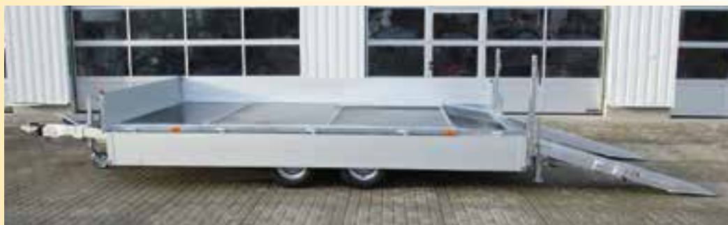
Sonderausstattungen: Anhänger Ladefläche heckseitig abgeschrägt, Rampen fest angebaut - klappbar, ALTEC-ALU-Rampen L x B 1970 x 400 mm mit klappbarem Abstützbock, nur in Verbindung mit Bereifung 225 / 55 R 12 LH ca. 670 mm