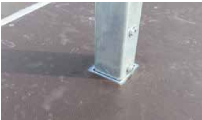
Sonderausstattung: Steckbare Säulen (80 x 80 mm) mit Sicherung in der Ladefläche integriert