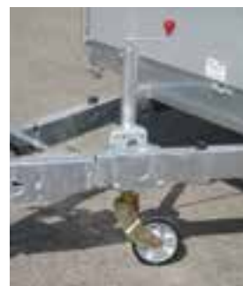
SR 60 VA Stützrad 60 mm Vollautomatisch