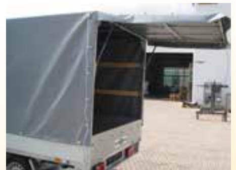
Sonderausstattung: Hochplane mit Ausstell-Element (Optional auch Planenaufroller)