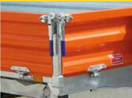
Sonderausstattung: Stahlbordwandaufbau verzinkt und zusätzlich lackiert, Pendelverschluss 664