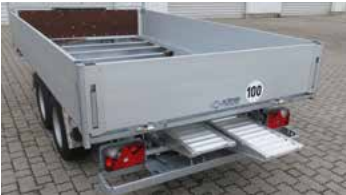
Sonderausstattungen: Rampenpaket mit Rampenschacht hinter klappbarem Unterfahrschutz, ALTEC-ALU-Einschubrampen 2,8 to / Paar, L x B 2410 x 310 mm, klappbare Heckstützen, Bereifung 225 / 55 R 12 - LH ca 670 mm, 100 km/h-Ausführung