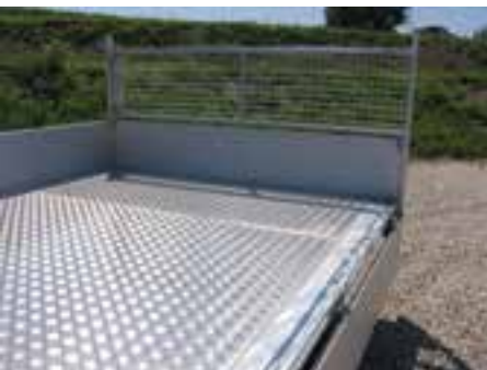
Sonderausstattung: ALU-Tränenblechboden auf Siebdruckboden, Stirnwanderrhöhung / Lastenschutzgitter verzinkt