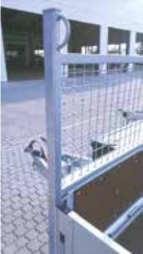
Sonderausstattungen: Stirnwandgittererhöhung 500 mm mit Zurrbügeln, Stirnwand-Innenverkleidung