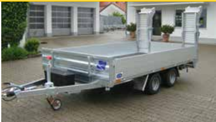
Sonderausstattungen: Stirnwand verstärkt aus Stahl verzinkt, ALTEC-ALU-Klapp-Faltrampen L x B ca. 2410 x 310 mm, Staubbox in der V-Deichsel, Stützrad vollautomatisch, Bereifung 225 / 55 R 12 - LH ca. 670 mm