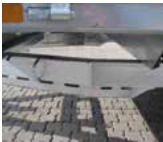
Serien-Detail: Hohlprofil-Hauptrahmen mit Unterzug im Übergang zur V-Deichsel

Sonderausstattung: Räder 225/55 R 12 – LH ca. 670 mm, Stützrad verstärkt 70 mm, Kunststoffstaukasten 550 x 250 x 290 mm a. d. Stirnwand, Rampenpaket mit klappbaren Heckstützen