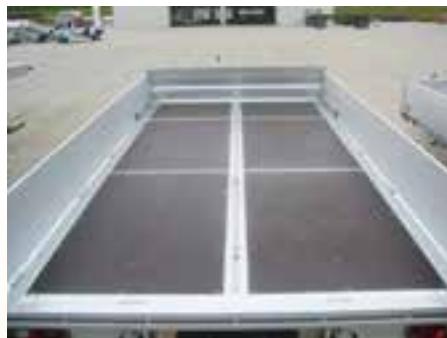
Sonderausstattungen: Mittel-Zugschiene mit hochziehbaren Zurrbügeln, Bodenrahmen vorne und hinten mit Sicke und Zurrbügel