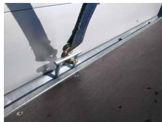
Serien-Detail: Hochziehbarer Zurrbügel (800 daN) im Bodenrahmenprofil mit V-Sicke