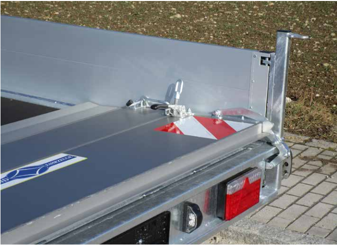
Serien-Detail: Heckklappe auch nach vorne umlegbar (reduziert Luftwiderstand) Sonderausstattungen: Rampenheber (Gasfeder unten liegend), LED-Beleuchtung, Warnmarkierung DIN 30710