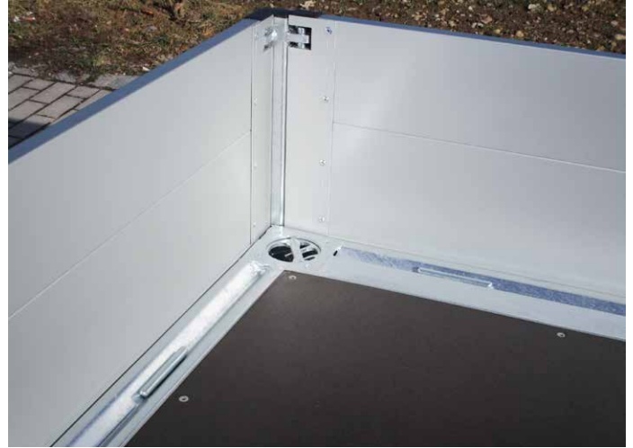
Sonderausstattungen: 4 drehbare Zurrpunkte in den Ecken (1250 daN) Bodenrahmen vorne und hinten mit Zurrbügel (wie seitlich)