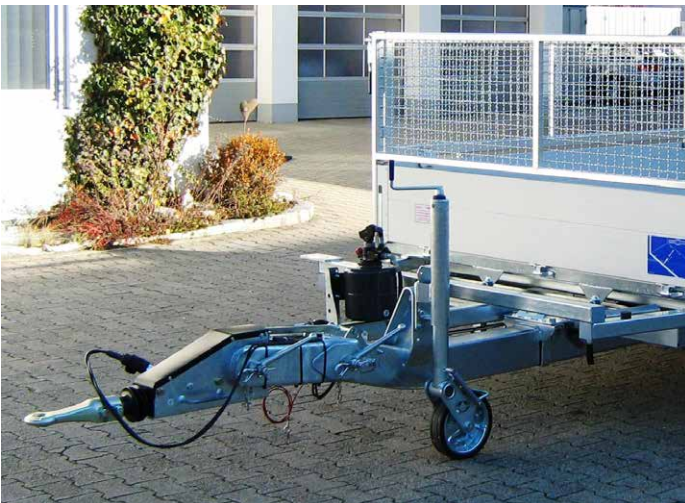
Sonderausstattungen: Höhenverstellbare Zugdeichsel mit 40 mm DIN-Zugöse (wechselweise Kugelkupplung), mit verstärktem 70er Stützrad, Welldraht-Gitteraufbau 600 mm hoch, verzinkt