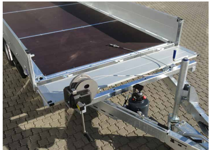
Sonderausstattung: Handseilwinde mit Seil-Umlenkrolle in der Breite umsteckbar