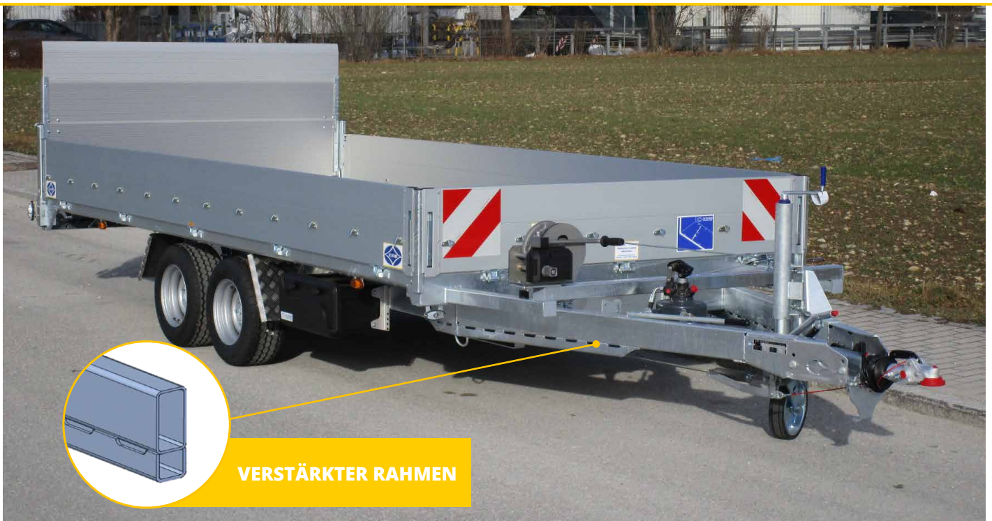
Abb.: UKT 350 UEK zul. GG 3.500 kg

Serien-Brücke 3,70 x 1,85 m, Räder 225/55 R 12 – LH ca. 670 mm