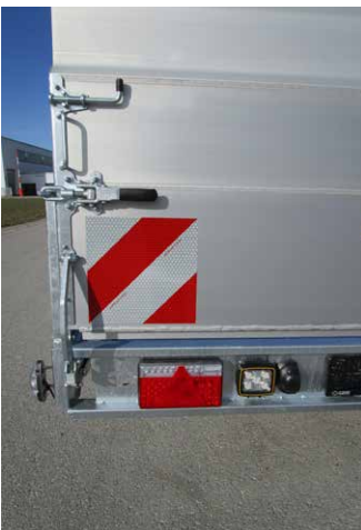
Sonderausstattungen: Rampenheber (Gasfeder) LED-Beleuchtung LED-Zusatz-Rückfahrcheinwerfer Warnmarkierung DIN 30710 vorne u. hinten