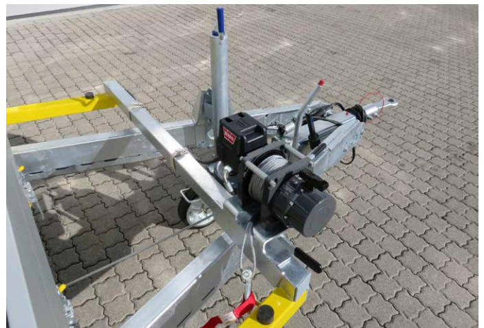
Sonderausstattungen: Elektr. Seilwinde mit Kabel und/oder Funksteuerung (Stromversorgung von Zugfz.- NATO-Stecker oder Batterieanlage Anhänger) Seilwinde in der Breite verstellbar