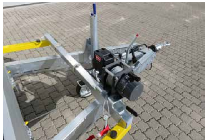
Sonderausstattungen: Elektr. Seilwinde mit Kabel und/oder Funksteuerung (Stromversorgung von Zugfzg.- NATO-Stecker oder Batterieanlage Anhänger) Seilwinde in der Breite verstellbar