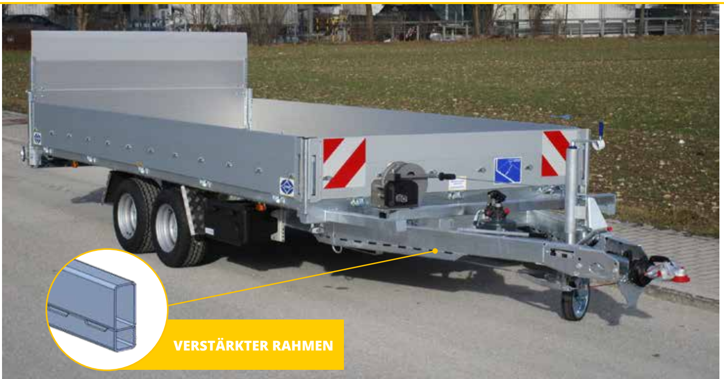
Abb.: UKT 350 UEK zul. GG 3.500 kg

Serien-Brücke 3,70 x 1,85 m, Räder 225/55 R 12 – LH ca. 670 mm