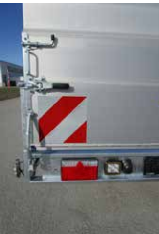
Sonderausstattungen: Rampenheber (Gasfeder) LED-Beleuchtung LED-Zusatz-Rückfahrcheinwerfer Warnmarkierung DIN 30710 vorne u. hinten