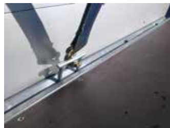
Serien-Detail: Hochziehbarer Zurrbügel (800 daN) im Bodenrahmenprofil mit V-Sicke