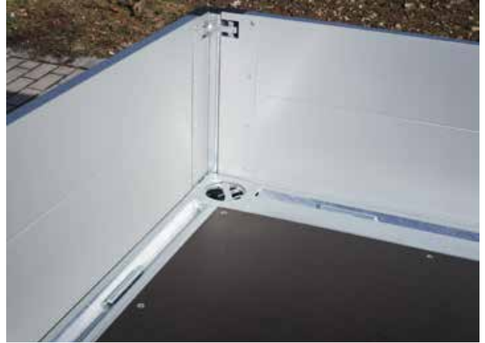
Sonderausstattungen: 4 drehbare Zurrpunkte in den Ecken (1250 daN) Bodenrahmen vorne und hinten mit Zurrbügel (wie seitlich)