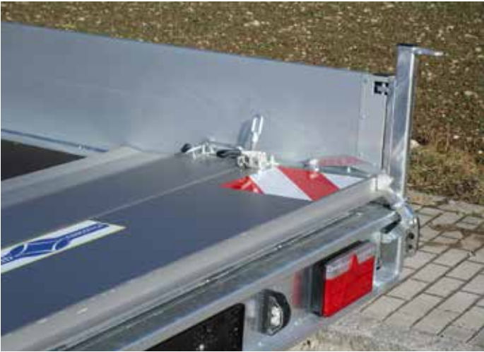
Serien-Detail: Heckklappe auch nach vorne umlegbar (reduziert Luftwiderstand) Sonderausstattungen: Rampenheber (Gasfeder unten liegend), LED-Beleuchtung, Warnmarkierung DIN 30710