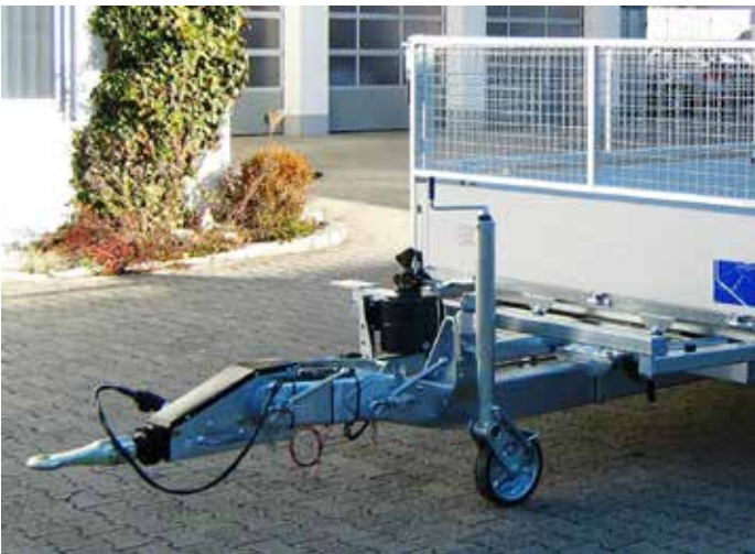
Sonderausstattungen: Höhenverstellbare Zugdeichsel mit 40 mm DIN-Zugöse (wechselweise Kugelkupplung), mit verstärktem 70er Stützrad, Welldraht-Gitteraufbau 600mm hoch, verzinkt