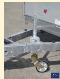
SR 60 VA Stützrad 60 mm Vollautomatisch