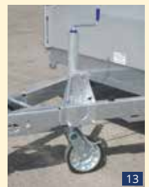
SR 70 HA Stützrad 70 mm Halbautomatisch