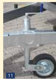
SR 60 KS Stützrad 60 mm – Klemmschelle