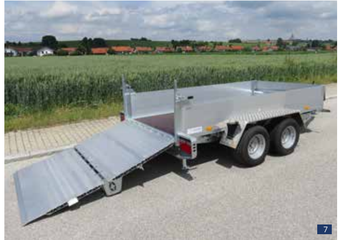
Abb. 6 - 7: PVT 30 KFR, zul. GG 3.000 kg – Serienbrücke 3,00 x 1,50 m, Serienräder 225/55 R 12 – Serien-Ladehöhe LH ca. 480 mm Sonderausstattungen: ALU-Bordwände silber eloxiert anstelle Stahlwände verzinkt, LED-Beleuchtung