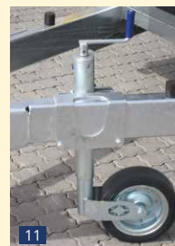
SR 60 KS Stützrad 60 mm – Klemmschelle