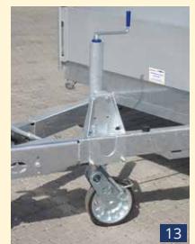
SR 70 HA Stützrad 70 mm Halbautomatisch