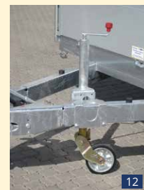
SR 60 VA Stützrad 60 mm Vollautomatisch