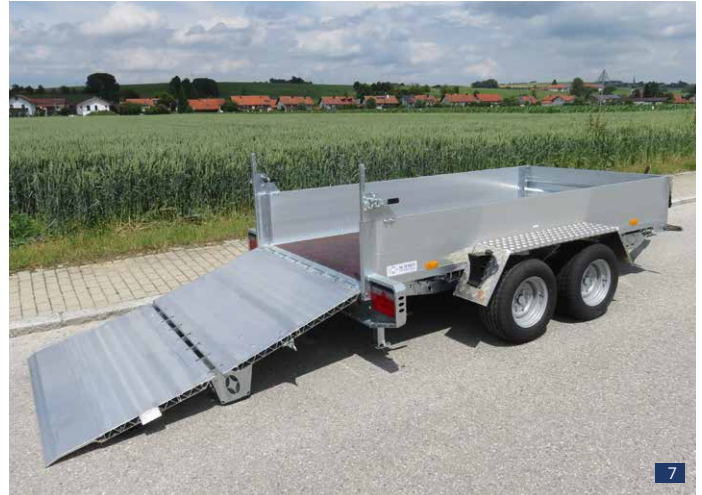
Abb. 6 - 7: PVT 30 KFR, zul. GG 3.000 kg – Serienbrücke 3,00 x 1,50 m, Serienräder 225/55 R 12 – Serien-Ladehöhe LH ca. 480 mm Sonderausstattungen: ALU-Bordwände silber eloxiert anstelle Stahlwände verzinkt, LED-Beleuchtung