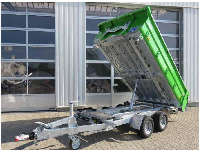
Sonderausstattung Kippmulde lackiert in RAL-Ton nach Kundenwunsch.