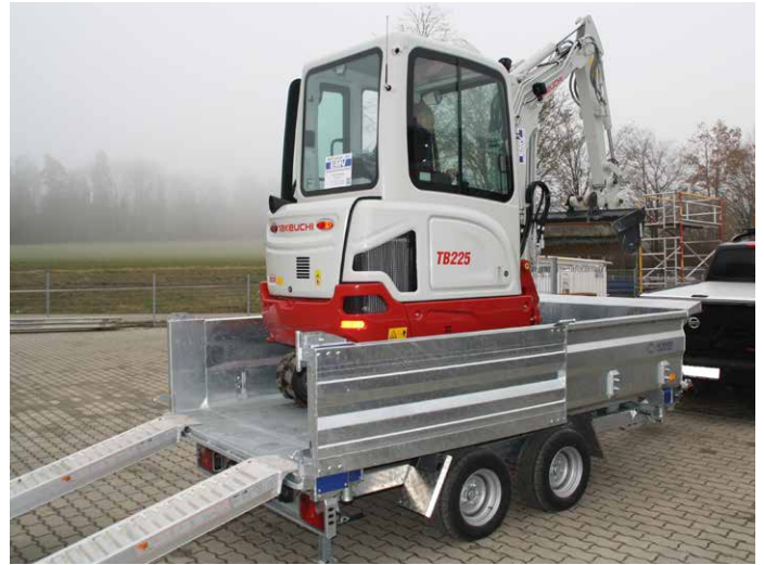
Heckwand geöffnet an Seitenwand arretiert. Heckabstützung abgeklappt.