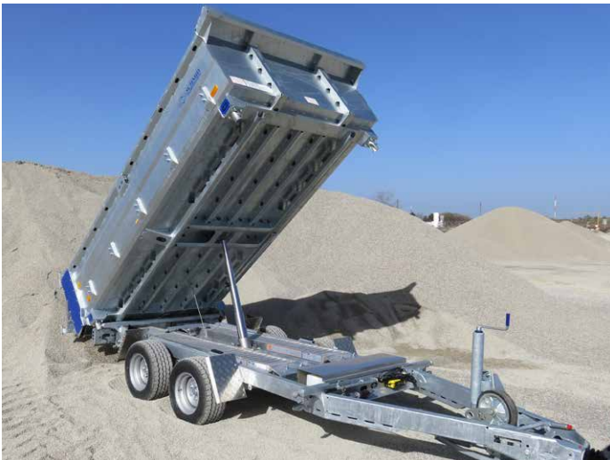
Fahrgestell mit stabilem und verwindungssteifem Hohlprofilrahmen mit Unterzug verstärkt. Kippmulde mit engem Trägerabstand für hohe Punktlasten.