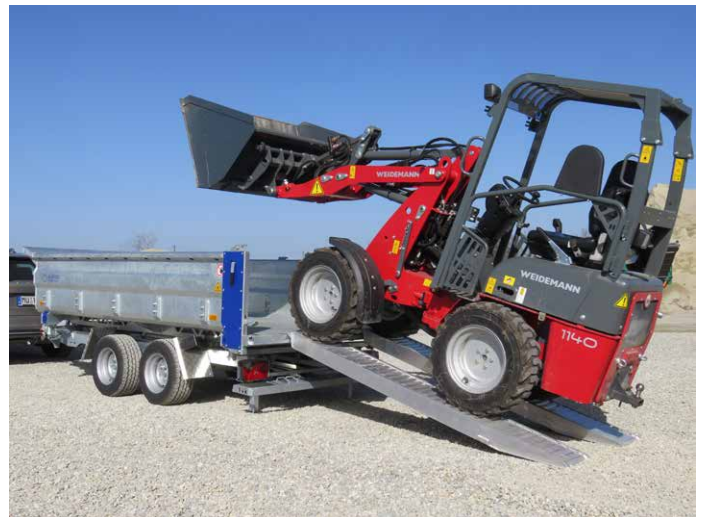
Seitenkasten-Abdeckung in RAL-Ton nach Kundenwunsch möglich. Heckabstützung abgeklappt für Maschinenverladung.