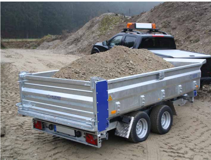
Mulde in Schweißkonstruktion im Tauchbad feuerverzinkt, Blechstärke 2,5 mm Seiten- & Heckwand, 3 mm Muldenboden.