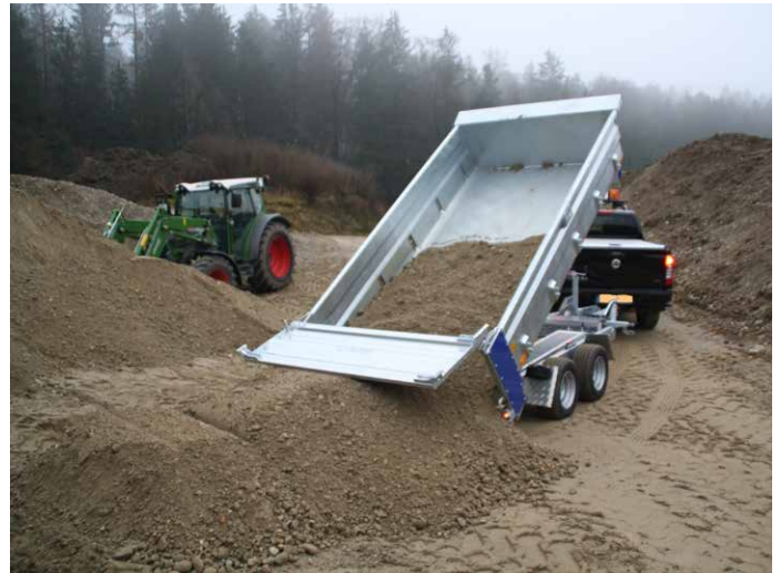
Heckwand beim Kippen automatisch öffnend → pendelnd. Schutz der Heckleuchten beim Abkippen durch verlängerte Kipperbrücke.