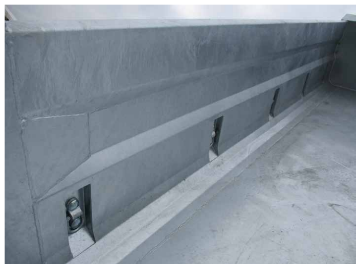
Serie: 5 Paar Zurringe in den Seitenwänden versenkt integriert und durch die Einbaulage „selbstreinigend“