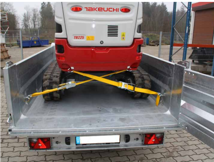
Muldenbreite 1.750 mm (unten 1.660 mm). Abgerundete und stabile Bodenkannte.