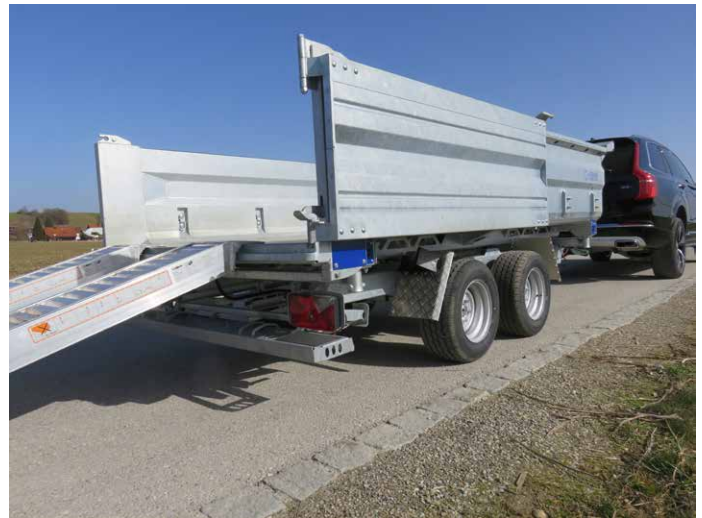
Rampenschacht unter der Kippmulde mit klappbarem Unterfahrerschutz. Heckwand geöffnet an Seitenwand arretiert.