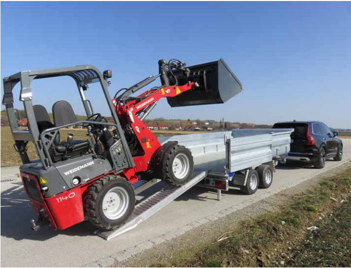
Alu-Rampen 2410 x 310 mm, Tragkraft 2890 kg / Paar. Heckwand geöffnet an Seitenwand arretiert.