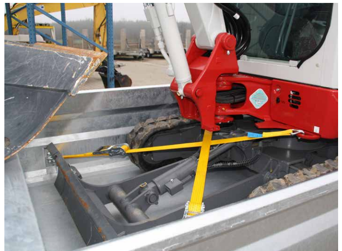
Zur sicheren Verzurrung von Baumaschinen je Seite 5 stabile Zurringe in den Seitenwänden integriert.