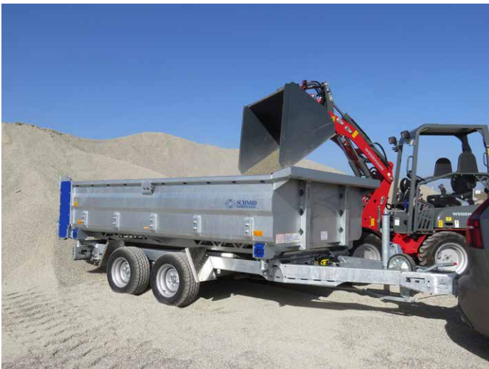
Kippmulde im Tauchbad feuerverzinkt. Stirnwand mit Schüttgut-Leitblech auch als Schaufelablage nutzbar.