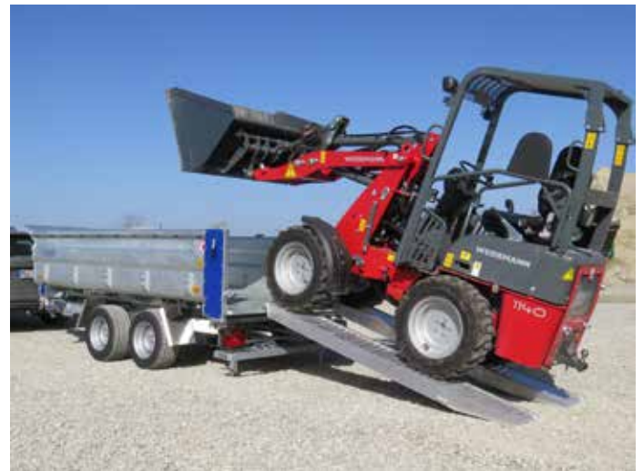
Seitenkasten-Abdeckung in RAL-Ton nach Kundenwunsch möglich. Heckabstützung abgeklappt für Maschinenverladung.