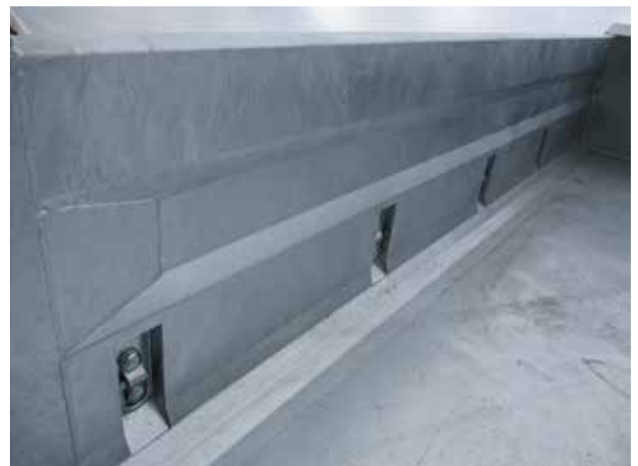
Serie: 5 Paar Zurringe in den Seitenwänden versenkt integriert und durch die Einbaulage „selbstreinigend“