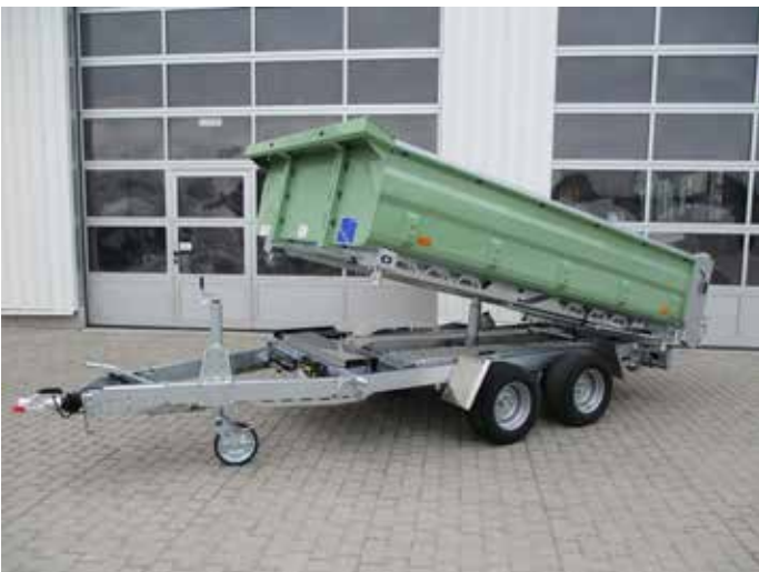
Sonderausstattung Kippmulde lackiert in RAL-Ton nach Kundenwunsch.