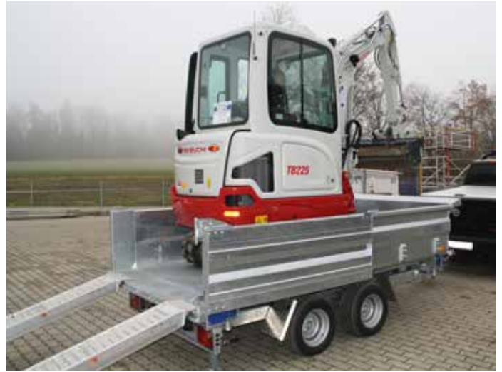
Heckwand geöffnet an Seitenwand arretiert. Heckabstützung abgeklappt.