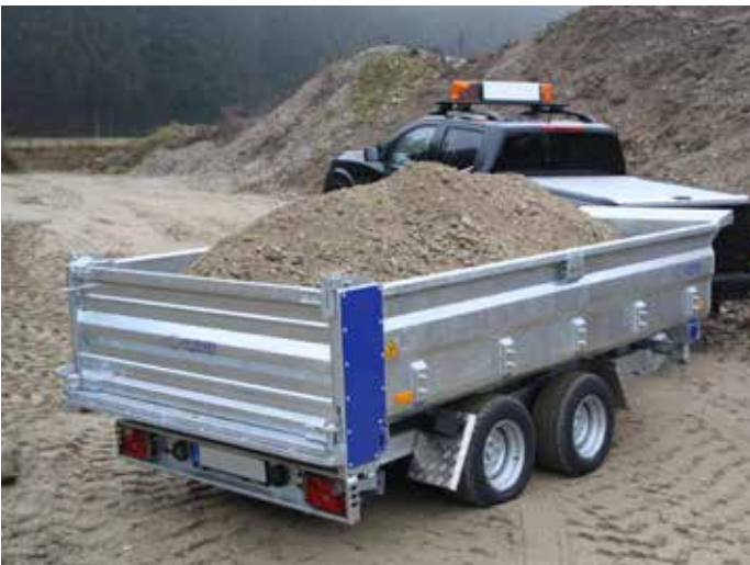
Mulde in Schweißkonstruktion im Tauchbad feuerverzinkt, Blechstärke 2,5 mm Seiten- & Heckwand, 3 mm Muldenboden.