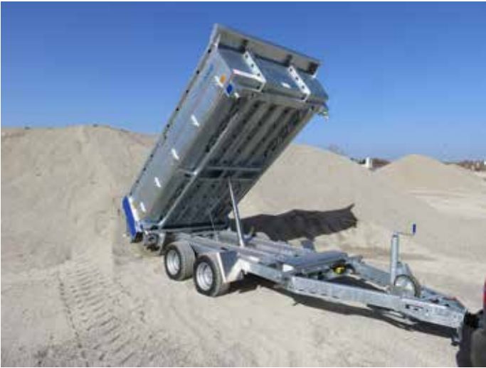
Fahrgestell mit stabilem und verwindungssteifem Hohlprofilrahmen mit Unterzug verstärkt. Kippmulde mit engem Trägerabstand für hohe Punktlasten.