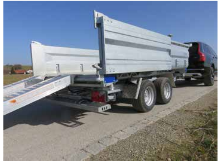
Rampenschacht unter der Kippmulde mit klappbarem Unterfahrerschutz. Heckwand geöffnet an Seitenwand arretiert.