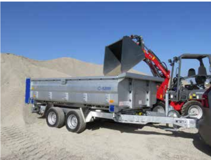
Kippmulde im Tauchbad feuerverzinkt. Stirnwand mit Schüttgut-Leitblech auch als Schaufelablage nutzbar.