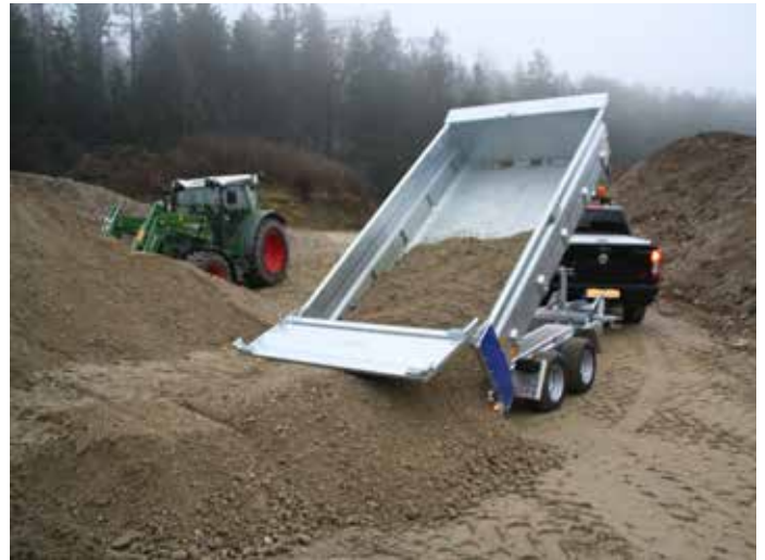
Heckwand beim Kippen automatisch öffnend → pendelnd. Schutz der Heckleuchten beim Abkippen durch verlängerte Kipperbrücke.