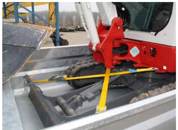
Zur sicheren Verzurrung von Baumaschinen je Seite 5 stabile Zurringe in den Seitenwänden integriert.