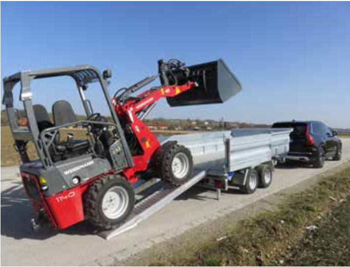
Alu-Rampen 2410 x 310 mm, Tragkraft 2890 kg / Paar. Heckwand geöffnet an Seitenwand arretiert.