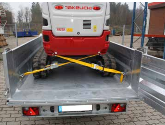
Muldenbreite 1.750 mm (unten 1.660 mm). Abgerundete und stabile Bodenkannte.