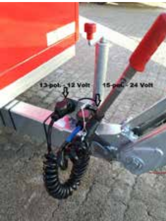
Sonderausstattung Bild links: Wendekabel 15 pol. 24 Volt und 13 pol. 12V nur in Verbindung mit LED-Rückleuchte Sonderausstattung Bild Mitte: Aufbau lackiert in RAL nach Wunsch, Kiemlüfter seitlich hinten und vorne (nicht sichtbar)