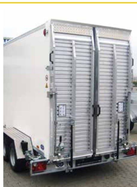
Abb.: GKA 270 RT

Serien-Detail: Bodenrahmen seitlich mit hochziehbaren Zurrbügeln Sonderausstattung: Mittel-Bodenschiene mit Sicke und hochziehbaren Zurrbügeln, Gummi-Streifen-Belag (z.B. für Walzen)