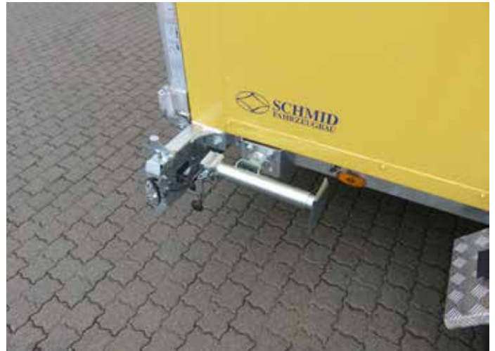
Serien-Detail: Schwenkbare Kurbelstütze Sonderausstattung: Aufbau lackiert in RAL nach Wunsch