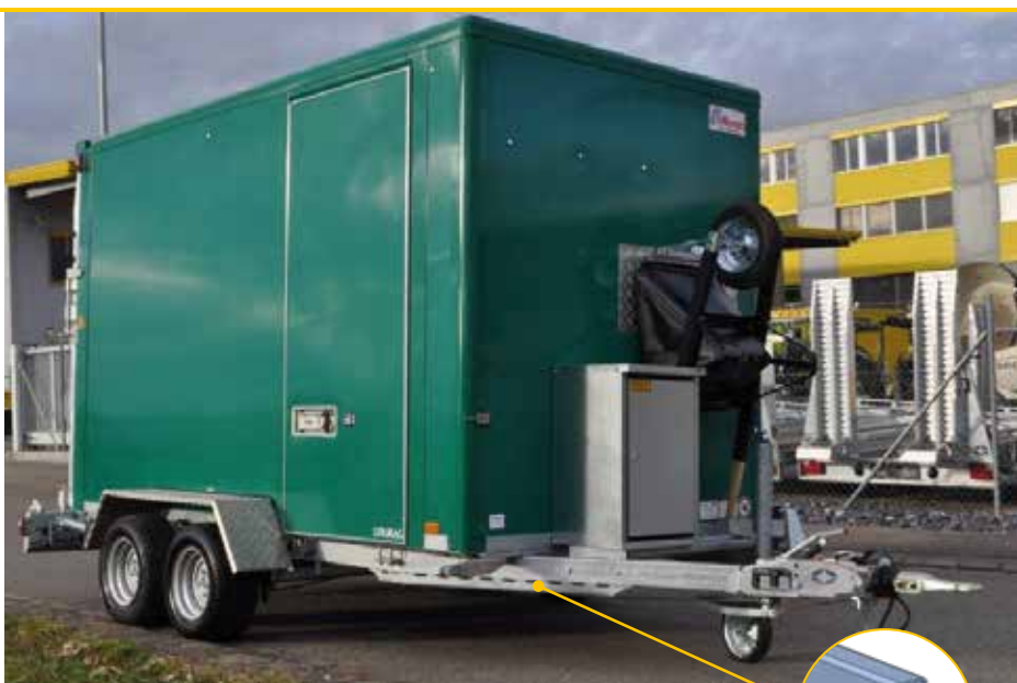
Abb.: GKA 350 RT

Ges. Gew.: 3.500 kg Aufbaumaße: ca. 3.500 x 1.700 x 2.100 mm Räder: 225/55 R 12 – LH ca. 520 mm