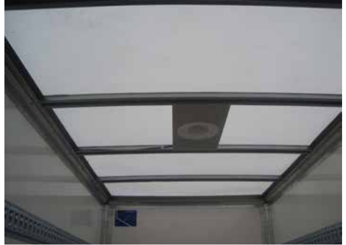
Serien-Detail: Lichtdurchlässiges Aufbaudach Sonderausstattung: Deckenleuchte (Schalter am Heck)