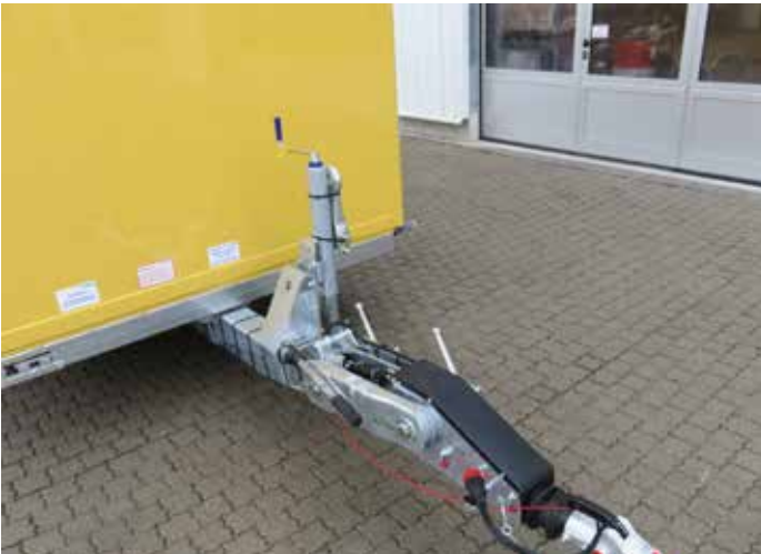
Sonderausstattungen: Höhenverstellbare Zugdeichsel mit Kugelkupplung (wechselweise 40 mm DIN-Zugöse), mit verstärktem 70er Stützrad, Aufbau lackiert in RAL nach Wunsch