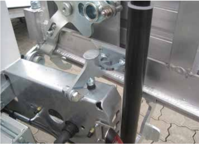
Serien-Detail: Türfeststeller und Gasdruckfeder als Hubhilfe