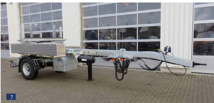
Abb. 7 + 8: Sonderausführung: Achse zum Rangieren lenkbar, mit bordeigenem elektr. hydr. Aggregat und Batterie-Anlage in Schutzkasten vor der Hinterachse Achtung: Keine Fahrlenkung – nur für Rangierzwecke bei Schrittgeschwindigkeit Weitere Sonderausstattung: große ALU-Maß-Staukästen nach Kundenwunsch