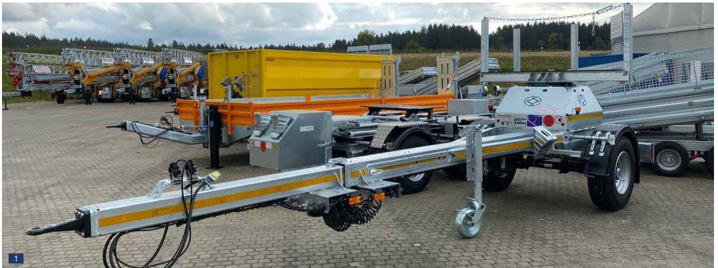
Abb. 1: Serienausführung in kürzester Deichsel-Stellung – ca. 6.000 mm, Zugdeichsel fix verbolzt für Leerfahrt