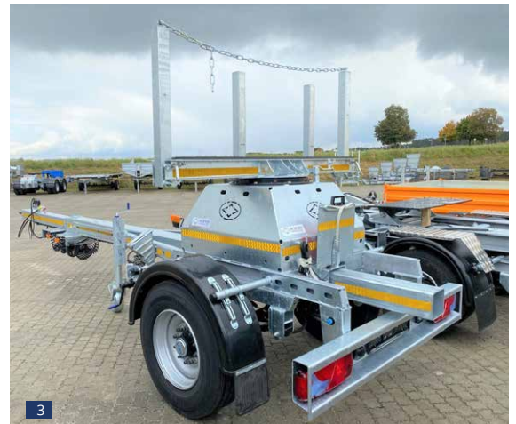
Abb. 3: Serienausführung Heckansicht