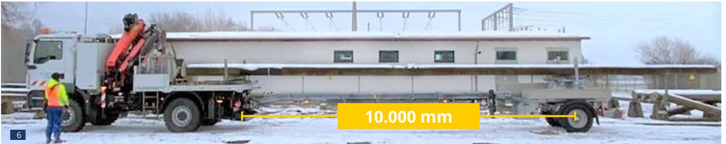
Abb. 6: In längster Deichsel-Stellung ca. 10.000 mm mit Masten ca. 16 m

Abb. 7 + 8: Sonderausführung: Achse zum Rangieren lenkbar, mit bordeigenem elektr. hydr. Aggregat und Batterie-Anlage in Schutzkasten vor der Hinterachse Achtung: Keine Fahrlenkung – nur für Rangierzwecke bei Schrittgeschwindigkeit Weitere Sonderausstattung: große ALU-Maß-Staukästen nach Kundenwunsch