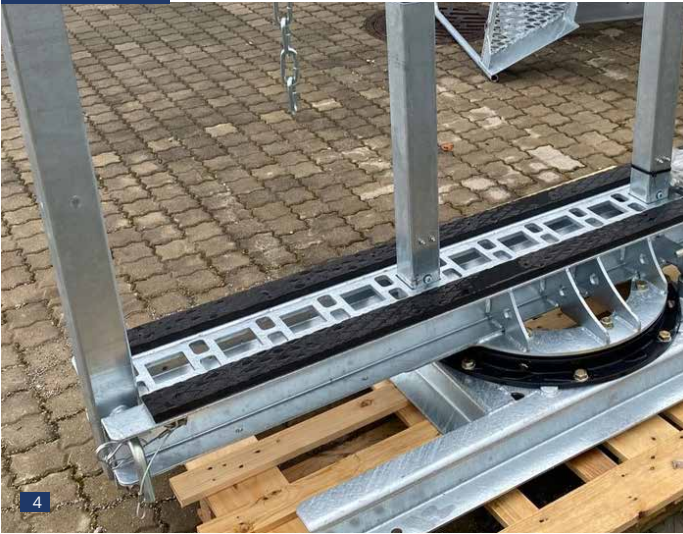
Abb. 4: drehbarer Ladeschemel für das Zugfahrzeug mit Montageschienen als lose Mitlieferung oder mit Anbau an das Zugfahrzeug, gegen Mehrpreis nach Aufwand