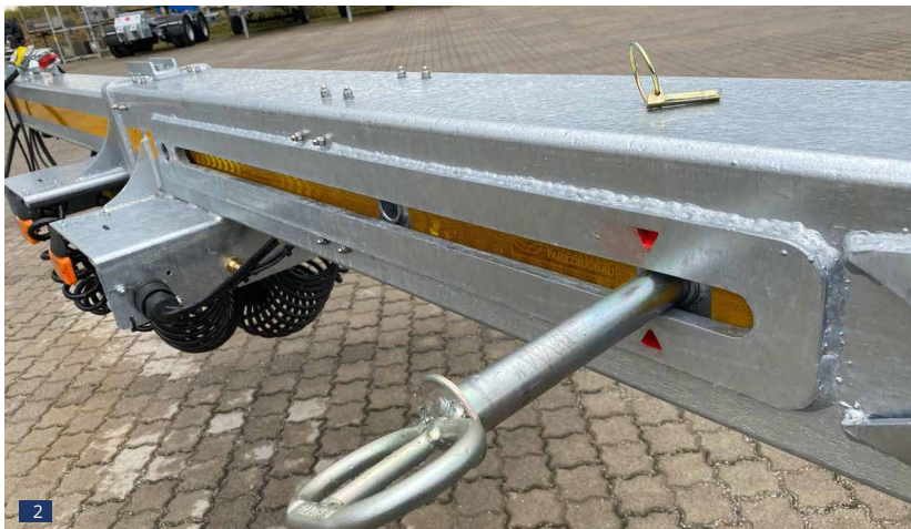
Abb. 2: Deichsel verbolzt für Material-Transport. Durch den Schlitz im Deichselholm ist ein Längenausgleich bei Kurvenfahrt gewährleistet.