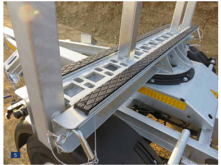
Abb. 5: drehbarer Ladeschemel mit Gummi-Auflage, Spezial-Zurrschiene für Spannmittel, klappbare Außenrungen und Zusatz-Steckerungen zur optimierten Ladungssicherung (kraft- und formschlüssig)