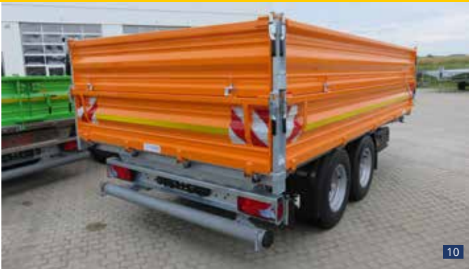
Abb.10: DK 105 - Heckansicht ohne Rampenschacht Sonderausstattung: Aufsatzbordwände pendelbar und abklappbar, Warnmarkierung, Staukasten aus Kunststoff

* Andere Maße auf Anfrage (u.a. Breite 2,18 / 2,30 m)