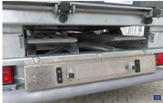
Abb. 12 bis 15: Serien-Rampenschacht mit klappbarem Deckel (abschließbar) für die komplette DK-AR-Baureihe mit ALTEC-Rampen VFR 8,7 to. (Option) Im Rampenpaket inklusive: 4 klappbare Eck-Zurringe 2 klappbare Heckstützen Abrutschsicherung für Anlegerampen (breitenverstellbar)