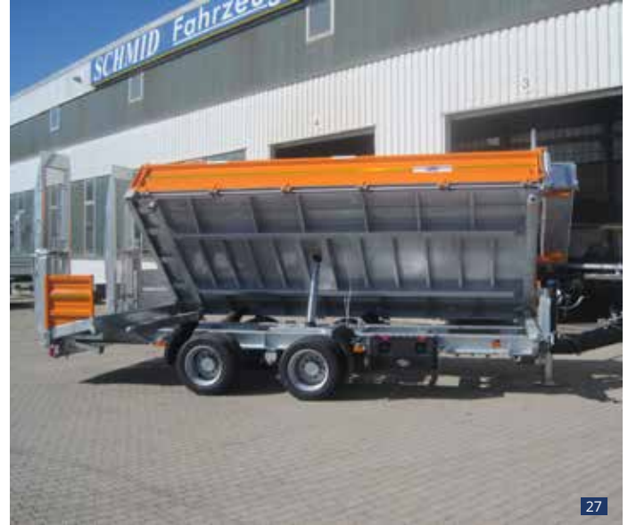
Abb. 26 - 27:

Sonderausstattung: Heck abgeschragt, Rampenlänge 1-teilig 2,30 m mit Gitterrostbelag, optische Seitenblende an der Schräge, Heckwand-Parkhalterung auf der Stirnwand, Staukasten aus Kunststoff seitlich