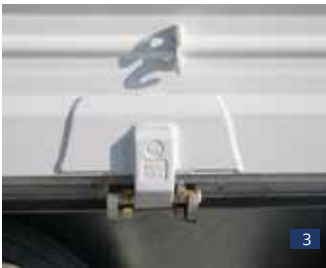
Abb. 3: Serien-Detail: Verstärkte Scharniere – gegen Rissbildung