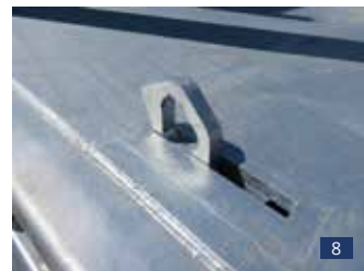
Abb. 8: hochziehbarer eben verbauter Zurring Quer-Zurkraft bis max. 2 t.