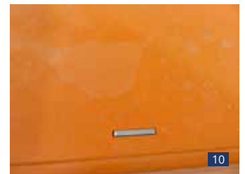
Abb. 10: hochziehbarer eben verbauter Zurring – versenkte Position (lackierte HARDOX-Brücke)