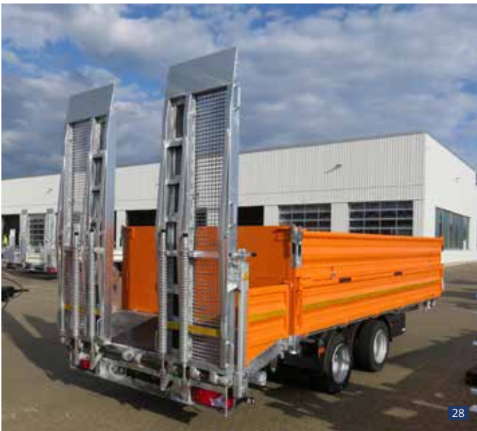
Abb. 28 - 29:

Sonderausstattung: Heck abgeschragt, Rampenlänge 1-teilig 2,30 m mit Gitterrostbelag, optische Seitenblende an der Schräge, Heckwand-Parkhalterung auf der Stirnwand, Staukasten aus Kunststoff seitlich