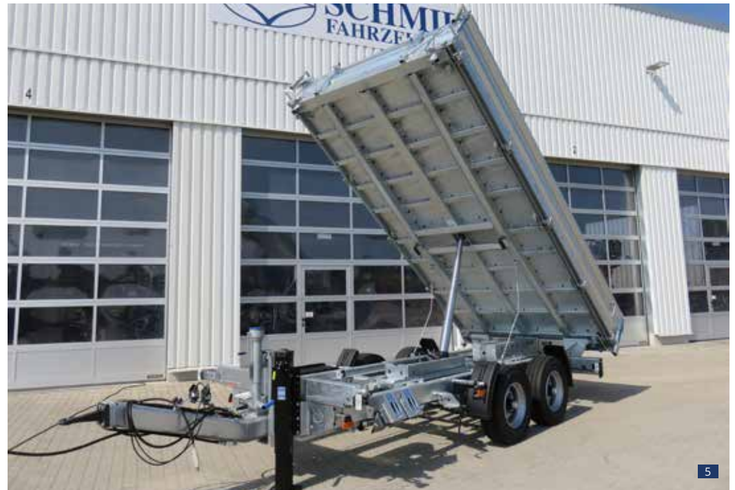
Abb. 5: DK 119 AR zul. GG 11.900 kg mit Rampen-Aufnahmeschacht im Fahrgestellrahmen "vollverzinkt" – in der Abb. noch ohne Außenlackierung des Bordwandaufbaus