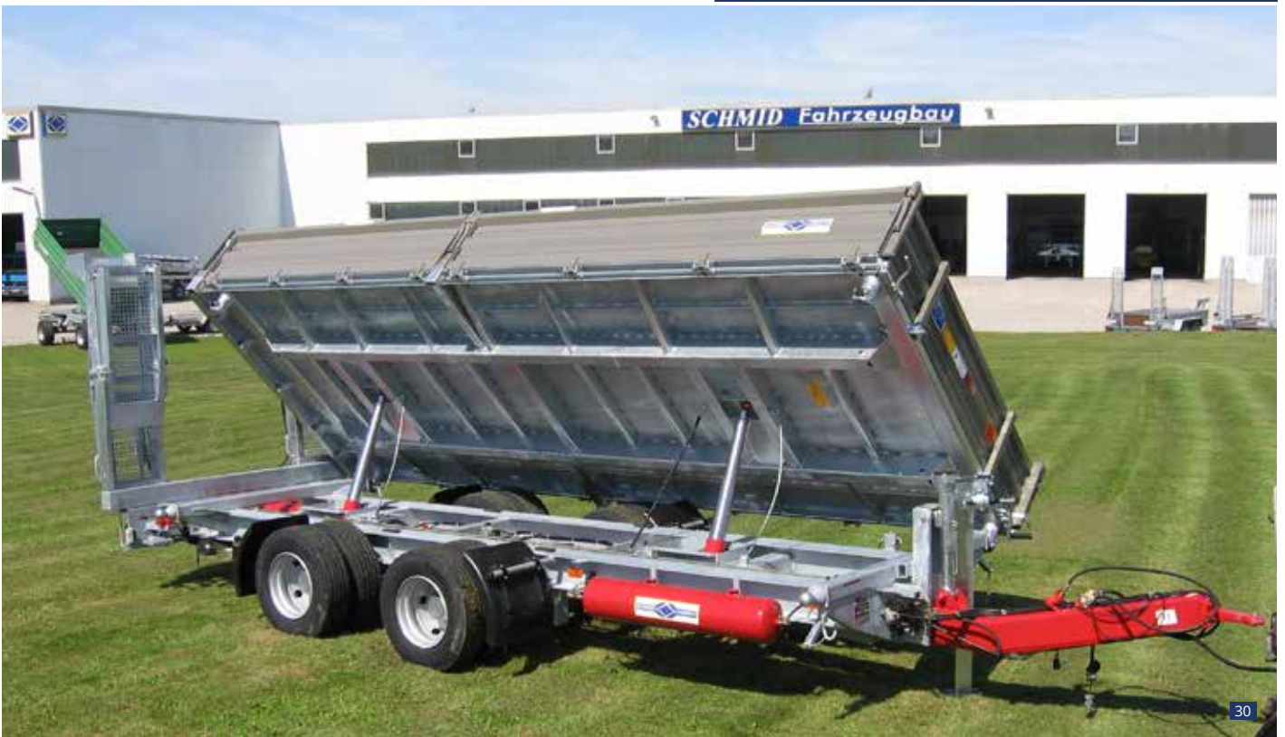
Abb. 30: Sonderausstattung: Brückenverlängerung auf 6,05 m, inkl. Mittelrungenteilung der Seitenwände, 2 hydr. Kippzylinder hintereinander, Luftfederung mit Heben & Senken