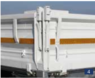
Abb. 4: Serien-Detail: Verstärkte Pendelverschlüsse – ab zul. GG 13 to.