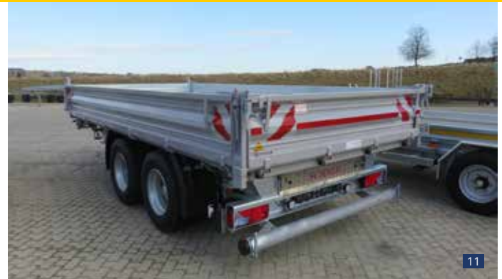
Abb.11: DK 135 AR - Heckansicht mit Rampenschacht, verstärkte Langhebelverschlüsse Serie ab 13,5 to. zul. GG Sonderausstattung: Breitereifung, Warnmarkierung, Heckwand abklappbar, pendelbar + schwenkbar