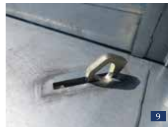
Abb. 9: hochziehbarer eben verbauter Eck-Zurring (45°) Zurkraft bis max. 5 t.