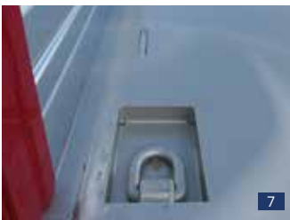
Abb. 7: klappbarer Eck-Zurring bis max. 6,3 t.