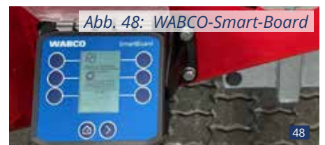
Abb. 48: WABCO-Smart-Board